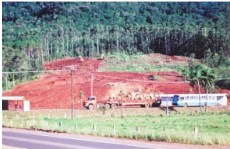
Desmatamento para duplicação da BR 101, em Morro Alto (RS)

No Rio Grande do Sul, as polêmicas em torno das comunidades quilombolas questionam a idéia de um Estado conhecido e reconhecido nacionalmente como "europeu". Situações como a vivenciada pela Família Silva, que ao longo dos primeiros dias de junho teve o despejo quase levado a termo, nos fazem pensar sobre qual o lugar reservado ao negro na cultura gaúcha e de que forma a sociedade está lidando com as questões de discriminação racial. Neste boletim, destacamos a situação das comunidades quilombolas, rurais e urbanas, no Rio Grande do Sul, enfatizando o conflito vivenciado pelo Quilombo da Família Silva e o início das obras de duplicação do trecho sul da BR 101 que implicará em transformações na comunidade quilombola de Morro Alto (RS).